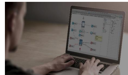
// ERP-System & DMS