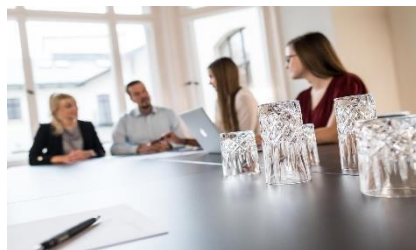
// Projektentwicklung & Consulting